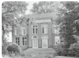
Landgoed Groenhoven, 1966.