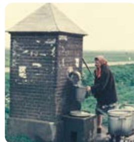
Een inwoner van Bruchem haalt water voor de was uit de dorpspomp, april 1957.