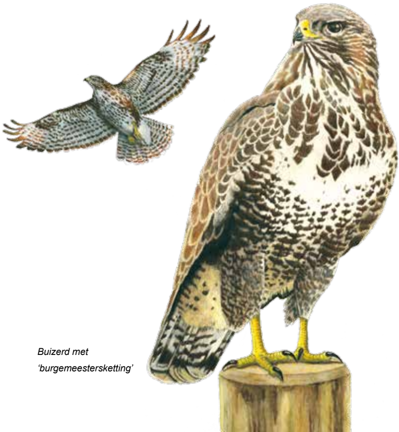
Buizerd met 'burgemeestersketting'

Qua verenkleed ziet elke buizerd er weer anders uit. Er zijn erg donker gekleurde en vrijwel geheel witte exemplaren. Bijna altijd hebben ze een 'burgemeestersketting' op hun borst: een ringvormige serie borstveertjes.