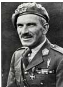
Generaal Sosabowski (1892-1967)