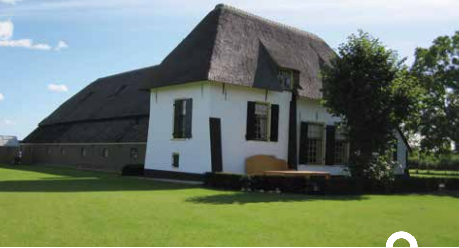
Boerderij 't Ooievaarsnest