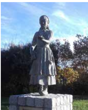
Kruuzemuntje, Cremerstraat, Driel