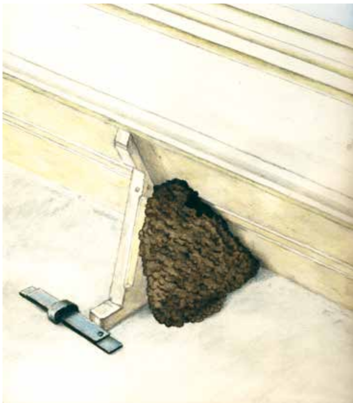
Zwaluwnesten onder dakrand

Aan de Baltussenweg ziet u bij enkele woningen onder de dakranden zwaluwnesten zitten. Ze metselen die van klei en plakken deze onder de dakgoot of -rand vast. Hier huist 's zomers de huis- of boerenzwaluw. Prachtige vogeltjes die door de lucht scheren. Aan de hand van de hoogte van hun vlucht kun je het weer voorspellen; bij mooi weer vliegen de insecten hoog, terwijl bij slecht weer insecten lager vliegen. Zwaluwen jagen in de lucht op insecten en zitten dus op dezelfde hoogte.