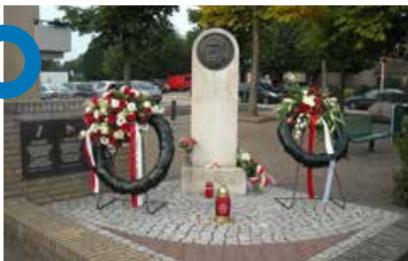
Sosabowski Memorial Appeal, Polenplein Driel