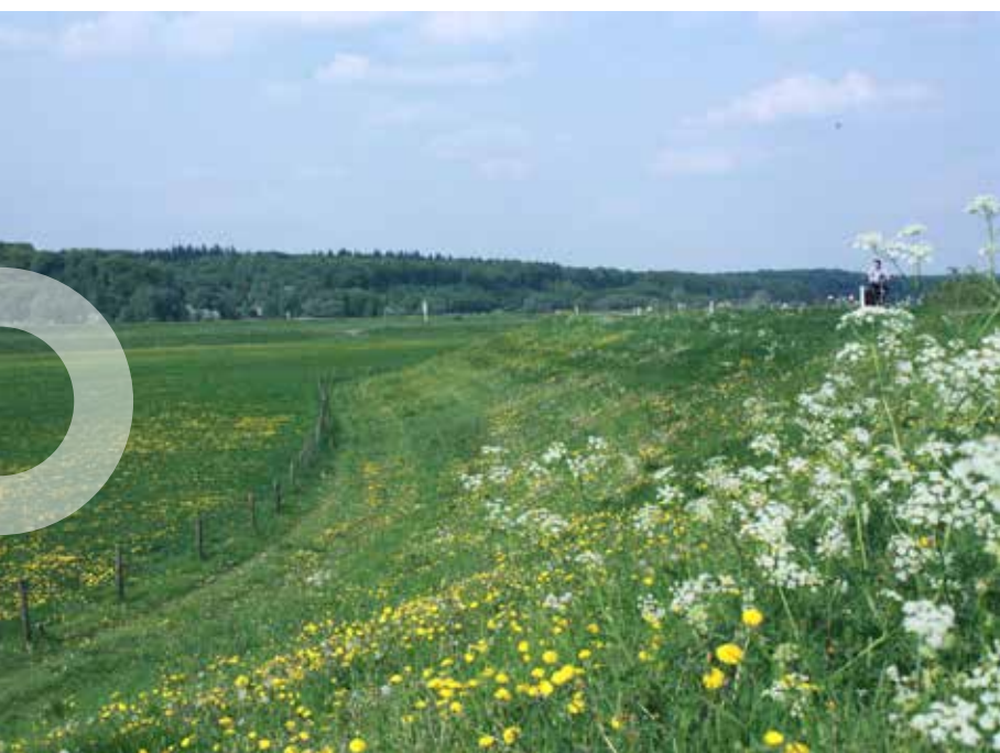
Fluitenkruid; door Jac. P. Thijssse ook wel 'Hollands Kant' genoemd.

De Betuwse dijken zijn van de 12e tot de 14e eeuw aangelegd. Zonder deze winterdijk - ook wel bandijk genoemd - zou de Betuwe bij hoogwater onder lopen. Die waterstroom kan beangstigend zijn. In 1995 stond het water een halve meter onder het dijkniveau. Er werd zelfs evacuatie overwogen. Uiterwaarden zijn in eerste instantie bedoeld voor waterberging. De vruchtbare uiterwaarden zijn daarnaast in gebruik als weide en hooiland. De dikke kleilagen die zich in de uiterwaarden hebben afgezet, bleken ook heel geschikt voor de fabricage van bakstenen. In de loop van de tijd zijn overal langs de rivieren steenfabrieken verrezen. Zo hebben er in Driel ooit 6 steenfabrieken gestaan.