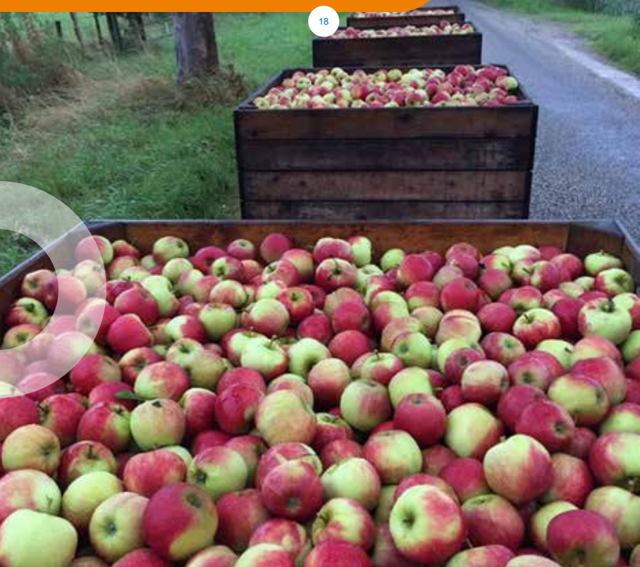
“Appeltrein” in de Overbetuwe