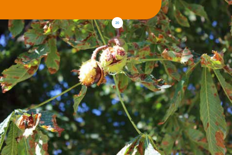
Kastanjes aan de Kastanjelaan.