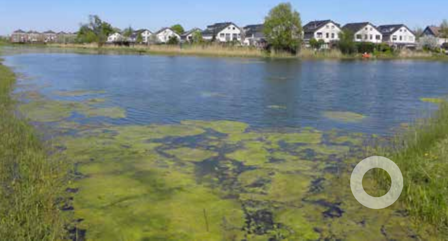
De steenovenplas in de zomer

Ga op de kruising met de O.L. Vrouwestraat links en dan na het water links het voetpad op.