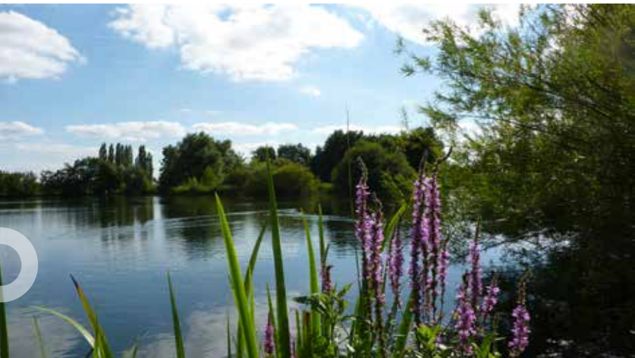
Een van de vijvers op landgoed Overbetuwe

Landgoed Overbetuwe is een prachtig landelijk gelegen terrein van circa 12 hectare waar u kunt genieten van rust, ruimte en natuur. Er is ook een kinder- en zorgboerderij.