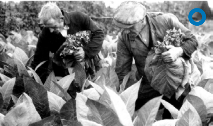
Mannen oogsten de tabaksbladeren

De tabaksboerderijen zijn een herinnering aan de tijd dat er veel tabak werd geteeld in de Betuwe. Deze periode begon in de 17e eeuw en duurde tot eind 19e eeuw, toen de concurrentie vanuit warmere streken zoals Nederlands-Indië te groot werd. De tabak werd in warme bakken geteeld, maar heel soms ook als onderteelt op een hoogstamboomgaard geplant.