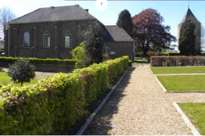
De Peperbus en de nieuwe kerk