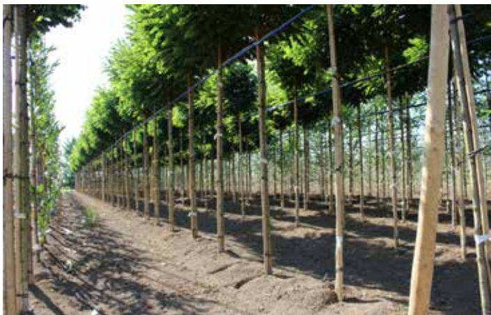
Laanboomkwekerijen ziet men veel in de Overbetuwe.

De verschillende boomsoorten staan door elkaar, dit is om zoveel mogelijk gebruik te maken van natuurlijke vijanden om zo bijvoorbeeld de luizenpopulatie te beperken. Het mooie van de laanboomteelt is, dat de jaargetijden zo duidelijk zichtbaar zijn.