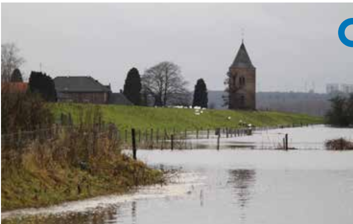
Hoog water is van alle tijden

Het gebouw met het bouwjaar 1815 in de gevelsteen is een vloedschuur. Dit soort schuren werd gebouwd op een kunstmatig verhoogd stuk grond. Bij hoog water konden hier het vee en de mensen in veiligheid worden gebracht. De verhoging wordt ook wel een woerd genoemd en is kenmerkend voor het rivierenlandschap. Sinds 2002 doet de gerenoveerde schuur dienst als kerk voor de protestantse Vloedschuurgemeente. Verderop in de straat staat een monumentale T-boerderij, de Steeg. Deze boerderij werd al in 1649 gebouwd en is daarmee de oudste boerderij van Heteren. Het waren ook de eigenaren van de Steeg die de vloedschuur bouwden. Hun initialen staan bij het bouwjaar in de gevelsteen van de schuur.