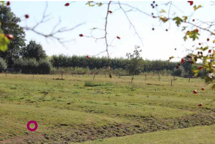
“Rabatdelen” langs de Drielse Rijndijk.

Bij hoge rivierstand - als de rabatlaagten zich vullen met kwelwater – profileert de rabatcultuur zich het scherpst. Dat de rabatruigen en – greppels nog in deze weilanden te vinden zijn, is te danken aan een vroegere landeigenaar. Door zijn bemoeienis ontsnapten kolk en rabatcultuur aan de aanslag van de ruilverkaveling. Tezamen vormen deze elementen een monumentaal landschap.