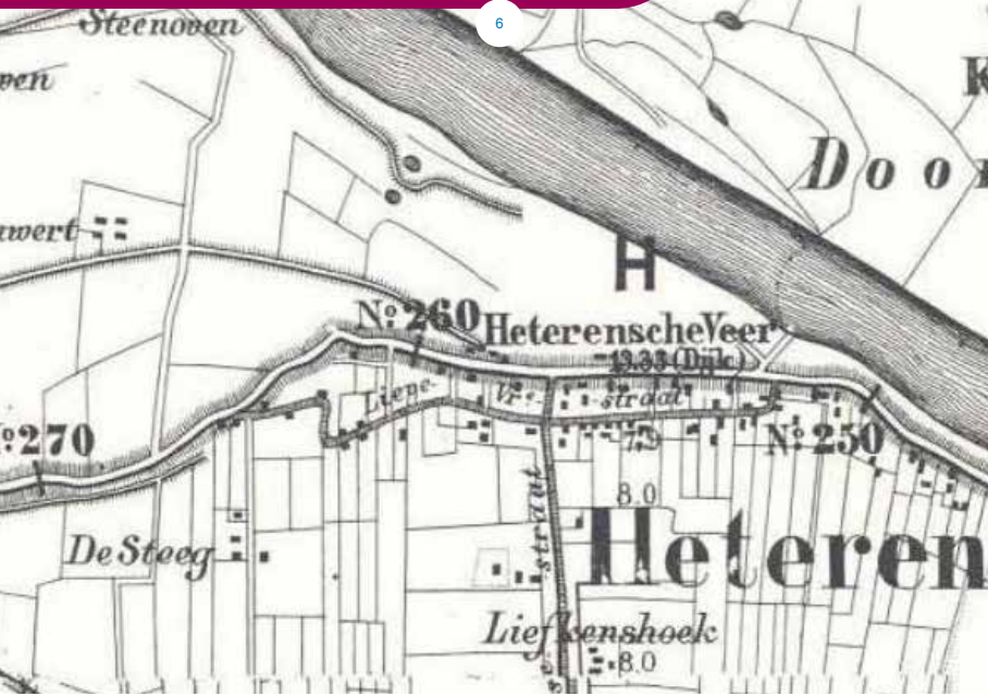
Heteren in 1871

Een slaperdijk is een dijk die het water niet direct tegenhoudt en als reservedijk dient.