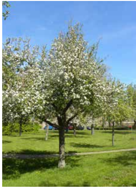
Een bloeiende Perenboom

Hoogstamboomgaarden worden gebruikt voor de fruitteelt. Vaak werd de ruimte onder de bomen gebruikt om vee te beweiden.