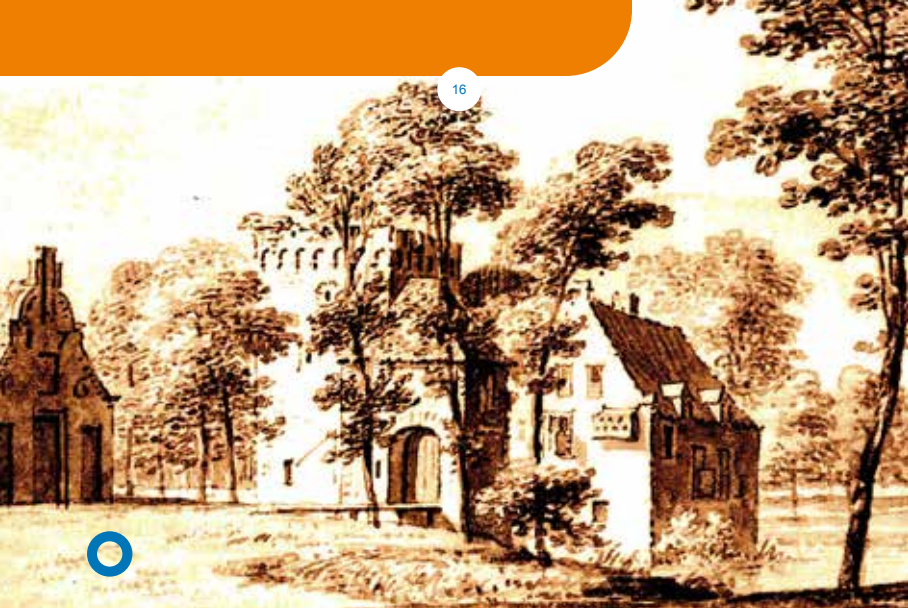
Kasteel "Den Rooden Toren"