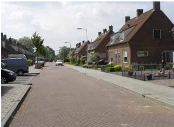
Wederopbouwoningen in de Vogelbuurt

In de Vogelbuurt, waar u nu doorheen loopt en de eerste delen van de Bloemenbuurt staan wederopbouwoningen. Na de Tweede Wereldoorlog werd deze wijk aangelegd voor arbeiders van de steenfabriek. De huizen hebben grote achtertuinen, die bedoeld waren voor de arbeiders om als moestuin te gebruiken.