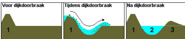
Het ontstaan van een wiel (1: Dijk, 2: Wiel, 3: Overslaggrond)

Boven aan de Rijndijk gekomen ziet u aan de rechterkant de restanten van een wiel, ook wel kolk genoemd. Bij een dijkdoorbraak kwam hier het water met zoveel kracht binnenstromen, dat het een heel stuk aarde heeft weggeslagen. Hierdoor is een waterplas ontstaan, het wiel, waar de dijk nadien omheen is gebouwd. Deze herinneringen aan de kracht van de rivier zijn kenmerkend voor het rivierenlandschap. Op het informatiebord is meer te lezen over het wiel.