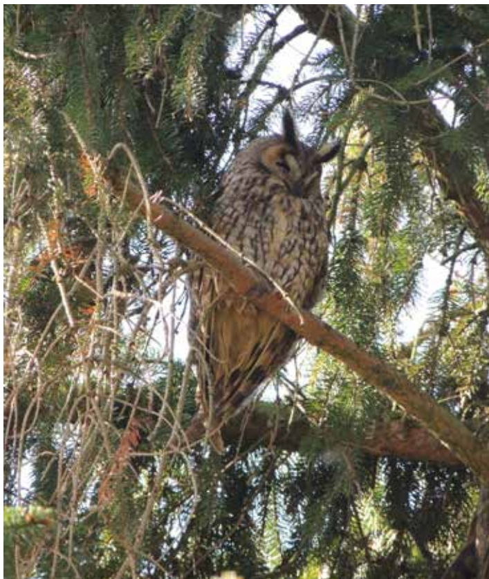
Een ransuil in de grote spar

Houd bij het vierkant van groene heggen rechts aan en vervolg uw weg.