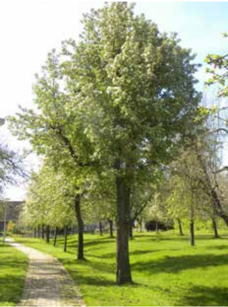
Een bloeiende appelboom