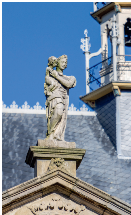
Beeld 'liefde' op toegangspoort voormalig weeshuis