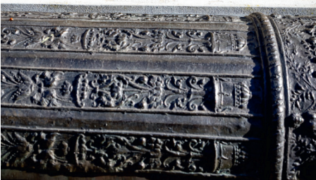
Kanon 'Queen Elizabeth's Pocket Pistol'