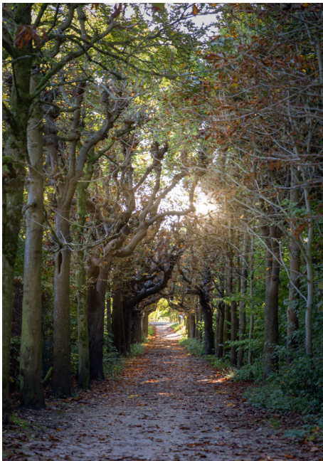
Vrijerslaantje of Kastanjelaantje