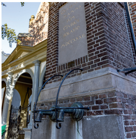
Stadspomp op de Markt