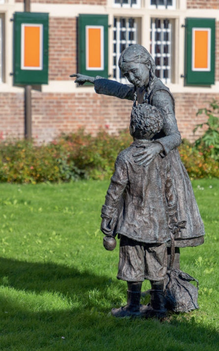
Standbeeld van twee weeskinderen