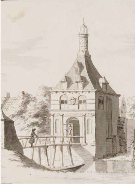
Tielse- of Vrouwenpoort 1750