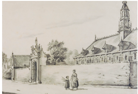
Weeshuis te Buren, 1815

Het Weeshuis is de meest tastbare ‘Oranje’ nalatenschap in Buren. Het initiatief voor de bouw komt van Maria van Nassau, dochter van Willem van Oranje Nassau en Anna van Egmont-Buren. De stichting van het Weeshuis is een voorbeeld van sociale betrokkenheid van de vrouwelijke adel bij het maatschappelijk leven. Maria stichtte het weeshuis in 1612. Ze overlijdt voordat het weeshuis in 1618 wordt geopend. Vanaf 1972 is in het weeshuis het Marechauseemuseum gevestigd. Tijdens een bezoek aan het Marechauseemuseum maak je ook kennis met de geschiedenis van het weeshuis.