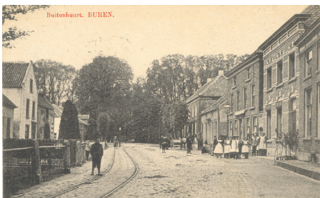
Buitenhuizenpoort (Buitenbuurt) met tramrails