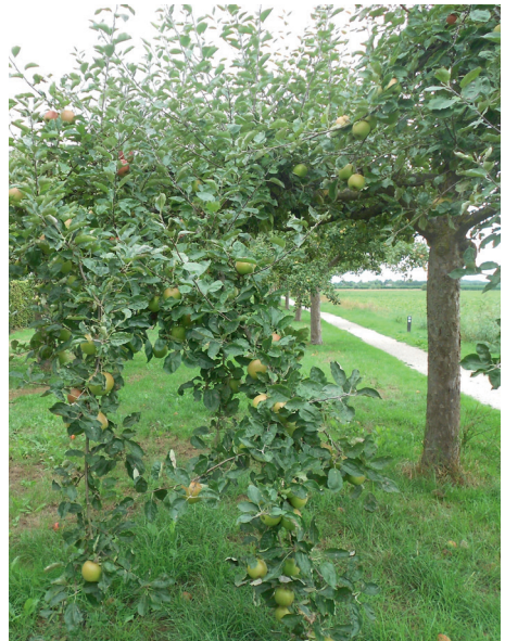
Hoogstamboomgaard De Toeren

In diverse publicaties wordt vermeld dat de vruchten worden geplukt door en voor de kinderen van het Weeshuis. Dit toetje van de weeskinderen zou ten oorsprong liggen aan de huidige naam: 'De Toeren'.