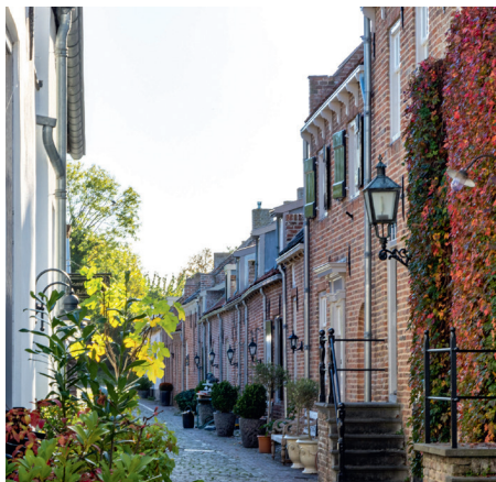
Muurhuizen aan de Kniphhoek