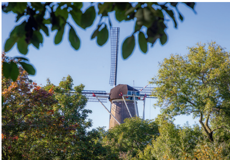
Korenmolens Prins van Oranje