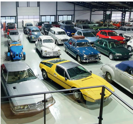
Oldtimermuseum Visscher Classique

Naast de auto's staan er 40 fietsen, bromfietsen en motoren van onder andere de merken Batavus, DKW, Eysink, Kroidler, Magneet, Peugeot, Royal Nord, Sparta, Yamaha en Zündapp. Het is ook mogelijk om naast het bekijken van de auto's een auto te huren voor: een rondrit, een foto- of filmrapportage of als trouwauto.