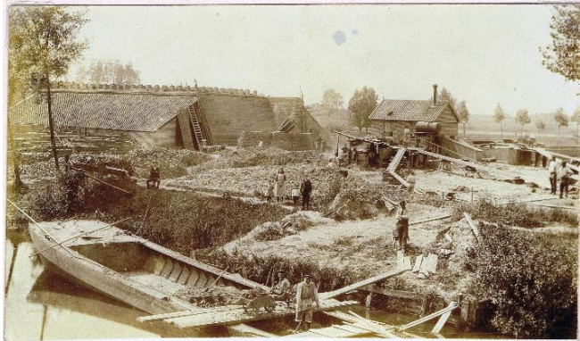
Afbeelding: De steenoven te Asperen rond 1905

We staan nu ongeveer op de locatie waar in 1905 bijgaande foto genomen is. We zien op de voorgrond de kleiaanvoer per boot, op de achtergrond de mechanische steenvormmachine, en links een van de steenovens.